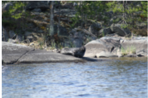
1. sija

Nyt kaikki kuvia näppäilemään vuoden 2013 kilpailuun. Tulokset arvioidaan syyskokouksessa. Kuvat voi lähettää sähköpostitse osoitteeseen risto.vesanto@pp1.inet.fi