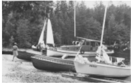
Kuva 2. Marco Päihänniemeessä 1975

Marcon aktiivinen käyttö vesipartiotoiminnassa kesti vuoteen 1975, jolloin se