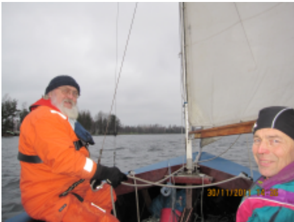
Myötäisessä Uimahallin kohdalla

Yllätys kaiken kaikkiaan oli Lightningilla purjehtimisen helppous. Vene oli vakaa eikä sillä purjehtiessa virran vaikutusta havainnut juuri ollenkaan. Rantautumisen jälkeen vene nostettiin trailerille ja tuotiin Lammassaareen suojattavaksi tulevaa talvea varten.