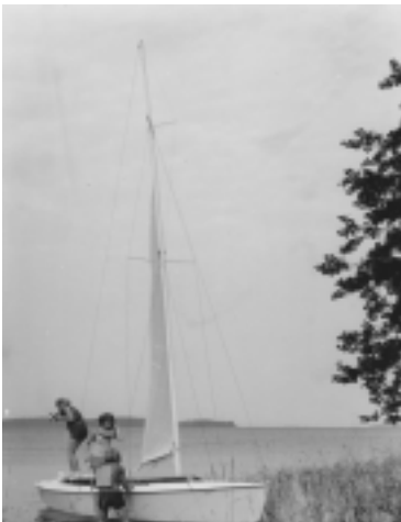
Kuva 1. Tulo Päihänniemeen Partioleirille 1967

haave vesipartiointiin ja oman purjevereen hankkimiseen. Tarpojat muodostuivat yli 14-vuotiaista partiolaisista. Aikaisemmin tarpojat olivat keskittyneet retkeilyyn. Hankkeen toteutumista varten kerättiin rahaa kolme vuotta joulukukien kasvattamisella, myyjäisillä, arpajaisilla, mainosten ja ilmaisjakelulehtien jakamisella sekä lehtiasiamiehinä toimimisena. Loppu rahoitettiin lainavaroin.