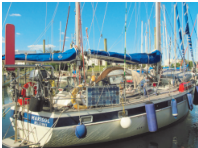
Kuvassa veneemme Mar Del Platan marinassa