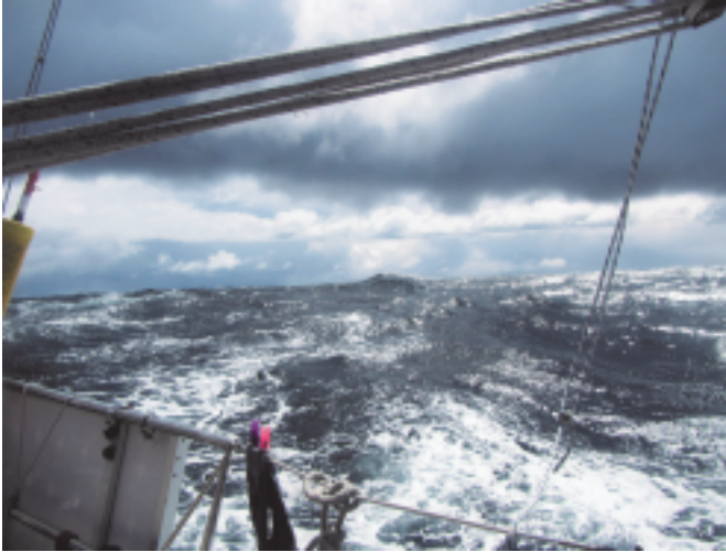
Kuvassa lähellä Tulimaan kärkeä

paistaessa lumihuippuiset vuoret pohjois-puolella loivat upean maiseman. Jouduttiin ajamaan paljon koneella ja vuorovesivirrat tekivät matkasta mielenkiintoisen.