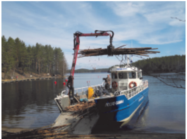
Polttopuuhuolto on jokakesäinen urakka. Kesällä 2013 Roope-Saimaa kuljetti 160 m3 polttopuurankaa retkisatamiin.

Retkisatamien huoltokulut kasvavat monesta syystä. Tietenkin vaikuttaa yleinen kustannusten nousu: polttoaine ja kaikki tarvikkeet kallistuvat. Myös uudet