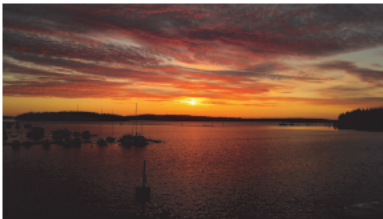
3. jaettu sija. "Impeä parhaimmillaan"