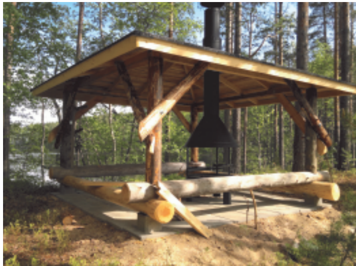
Pullikaisen grillikat. Retkisatama on sisälahdessa, jonne ohjaa yksityisvyläviitoitus.

Mikäli yksittäisiä veneilijöitä kiinnostaisi osallistuminen tulevana kesänä haastattelujen keräämiseen ja opaslehtisten jakamiseen satamissa omilla veneretkilleen, se on mahdollista ottamalla yhteyttä virkistysaluesäätiöön. Tausta-ajatuksena