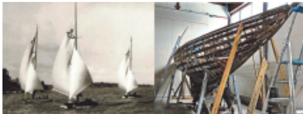
6 mR RENATA- nuoruutensa kukoistuksessa Sandhamnin regatassa joskus 1920 luvun lopulla ja nykytilassa

Purjehtijan muistelmat - on kirjaharvinaisuus, koska uusia painoksia ei ole