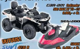
CAR-AM Outlander 500 MAXI 19–15 9.900,- + k.