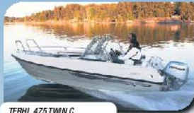
TERHI 475 TWIN C 11.900,- + k.