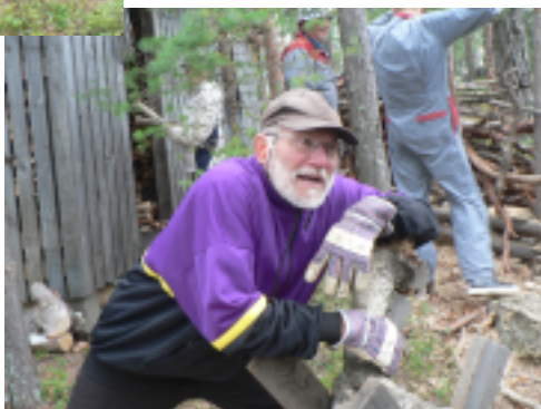
Rankkaa se oli...