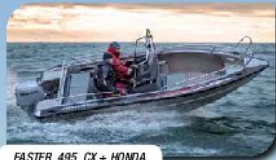
FASTER 495 CX + HONDA BF 60 yht. 23.900,- + k.

SUURI VENENÄYTTELY la 11.4. klo 10–15 ja su 12.4. klo 12–15