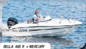
BELLA 485 R + MERCURY F 60 yht. 17.790,- + k.

MAAHANTUOJAN ESUSTA JÄ PAIKALLA! Lowrance, Maritim, Mercury, Honda MESSUTARJOUKSIA!