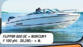
FLIPPER 600 DC + MERCURY F 100 yht. 38.290,- + k.