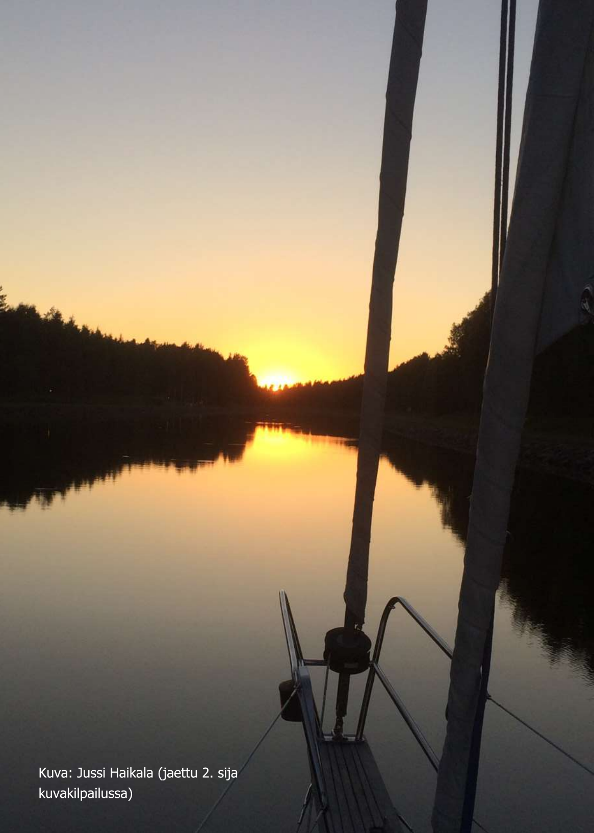
Kuva: Jussi Haikala (jaettu 2. sija kuvakilpailussa)