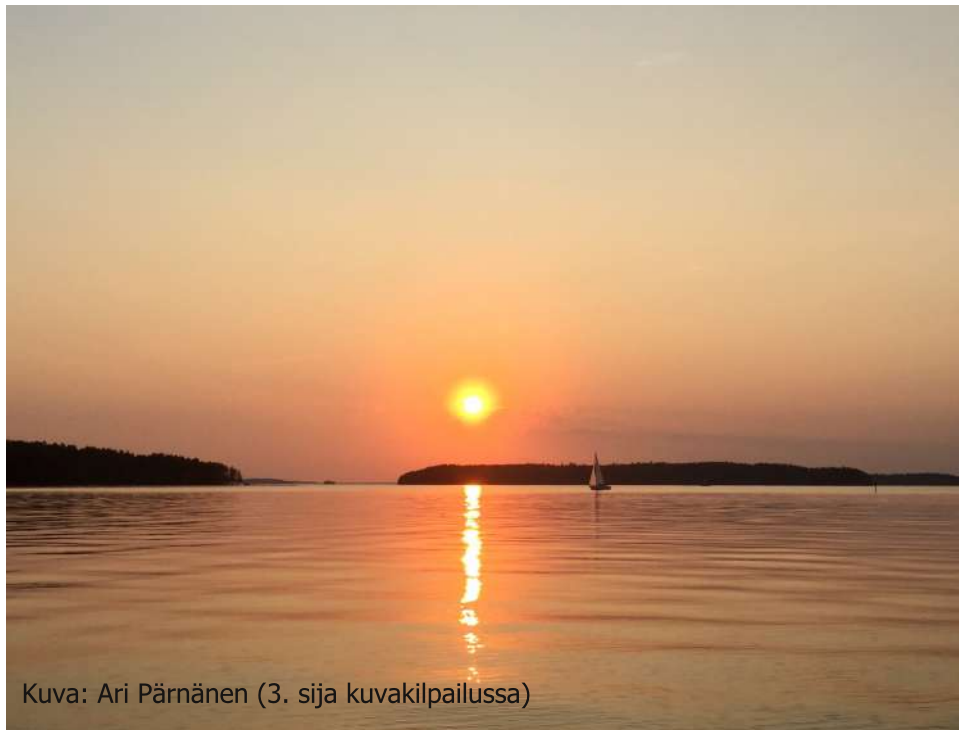
Kuva: Ari Pärnänen (3. sija kuvakilpailussa)

Etu perustuu Karttakeskuksen ja SPV:n yhteistyösopimukseen. Tavoitteena on mahdollistaa SPV:n jäsenyhdistysten jäsenille helppo tapa hankkia veneilykarttatuotteita.