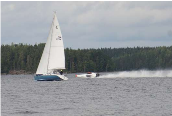
Vauhdikasta meenoa Saimaalla, kuvakilpailun 2. sija

Lisää tietoa Imatran Purjehdusseurasta sekä sen toiminnasta ja jäseneksi liittyminen: www.imps.fi