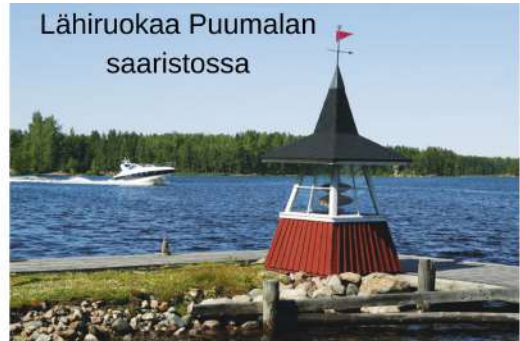
Lähiuokaa Puumalan saaristossa

päätteiden asennukseen, mikä tapahtui todella nopeasti ja kohta masto oli paikoillaan. Neitseellinen ensipurjehdus tapahtui lokikirjan mukaan heinäkuun 10. päivä kello 2200, aurinkoisessa 20°C lämpötilassa.